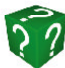
30 DÉS VERTS