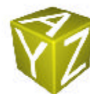
10 DÉS JAUNES