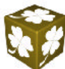
1 DÉ SUPER-JOKER

BUT DU JEU : TOTALISER LE PLUS GRAND NOMBRE DE POINTS.