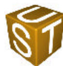
10 DÉS ORANGE